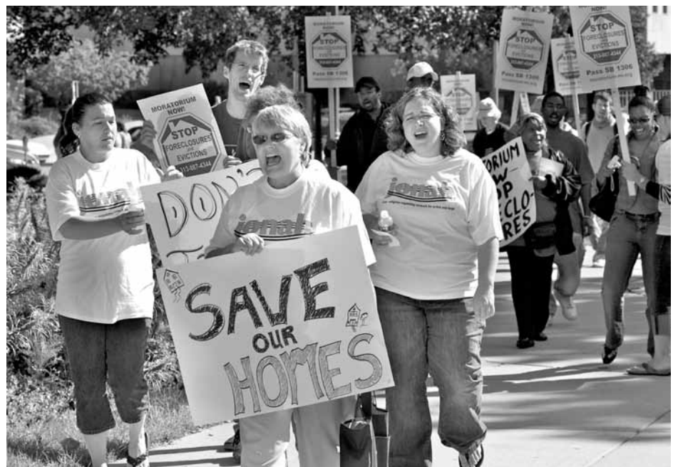
Anger and frustration of those who have lost or are about to lose their homes to the banks take to the streets.

And in Merced and city after city across the country, the political question is also the same – will local government serve the overwhelming majority of the people, the 99%, or will it become a weapon in the hands of the wealthy.