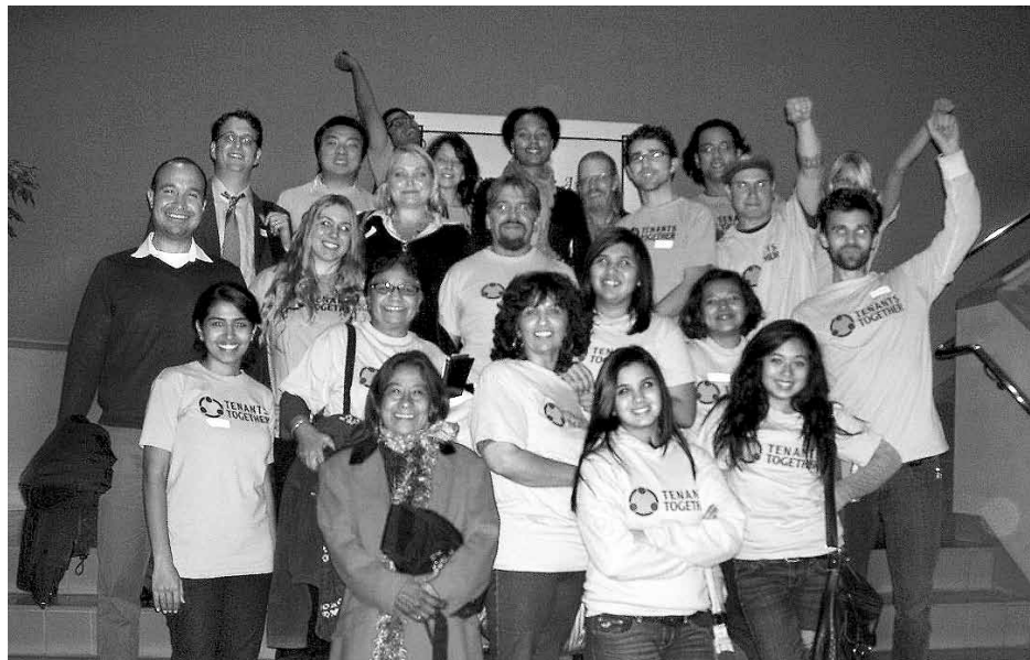
Inquilinos y apoyadores celebraron la aprobación de la Ordenanza para Desalojos con Justificación enactada por el ayuntamiento de la ciudad de Merced. Tenants and supporters celebrate passage of Just Cause Ordinance at Merced City Council.