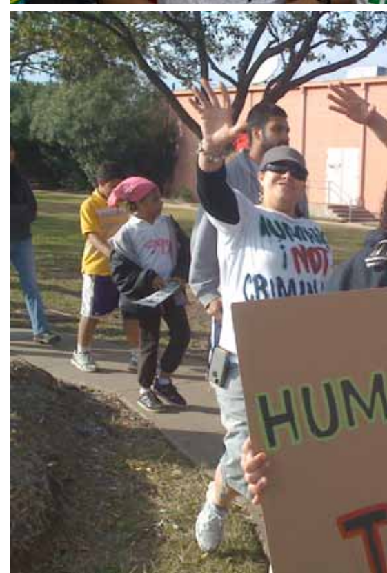
Thousands have protested and marched for the human