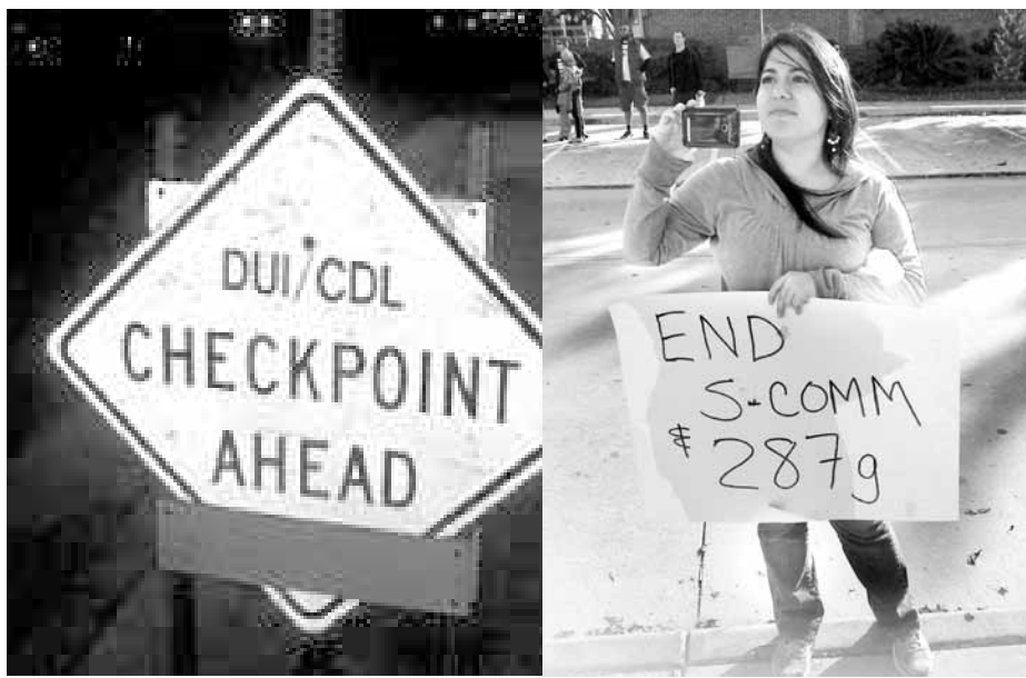
En California el 61 por ciento de los retenes se estableció en lugares con al menos un 3 por ciento de población hispana.

Se ha detenido a muchas personas indocumentadas debido a los denominados retenes para cerciorarse que las personas no estén conduciendo bajo la influencia del alcohol (DUI, por sus siglas en inglés). Y en California,