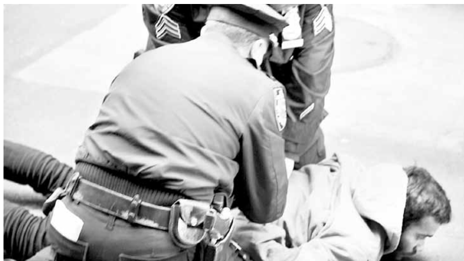
Occupy Wall Street protester arrested by NY police. We the people must utilize every aspect of democracy left to defend ourselves and advance our cause.

Millions are losing their jobs, homes and livelihood. Although the rulers will try to disorient the developing mass struggle, ultimately, they have no solution for them outside of fascism. Its features have been developing for some time. It is seen in the merging of the corporations and government which is the political