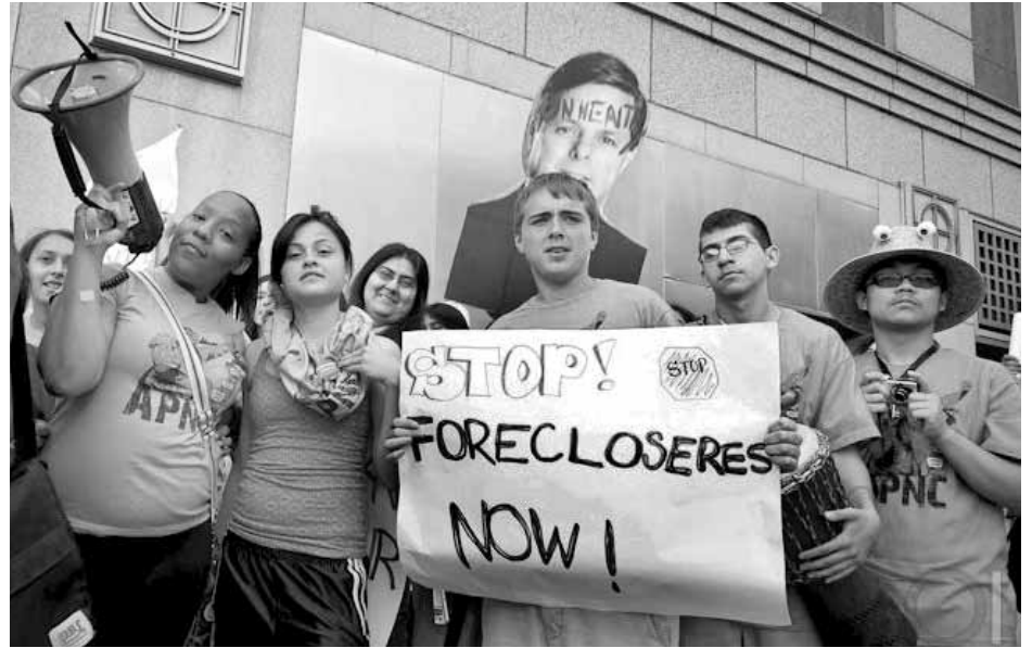
A national movement against evictions and foreclosures is growing as more and more people are evicted or their homes foreclosed.

Phase II of the opponents' plan is clear. The approval of "Just Cause for Evictions" by the outgoing city council was just a minor set back, as was the delay for the Fair Practices Commission decision. They have clearly announced that they will seek the repeal of the "Just Cause for Evictions" ordinance. And of course, they will count on the support of the new council members they helped to elect.