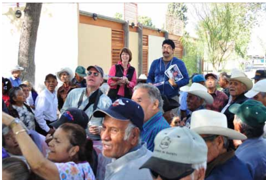
Desde hace siete años un grupo de ex braceros han estado tomando el Monumento a Benito Juárez y exigiendo lo justo, que se les devuelva el 10% que se les quitó de su pago.