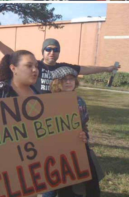
treatment of undocumented workers and their families.